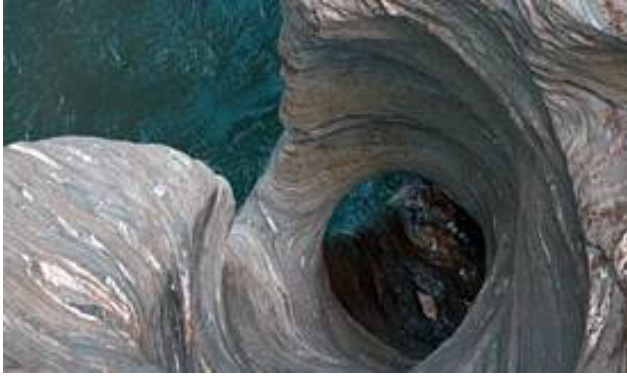
Gole della Via Mala formazioni rocciose modellate dall'erosione dell'acqua.

Sconfiniamo in Svizzera, tenendo la Via Spluga, in direzione Thusis con un'imperdibile sosta lungo la Via Mala per un'occhiata alle famose Gole della Via Mala formazioni rocciose create dall'erosione dell'acqua.